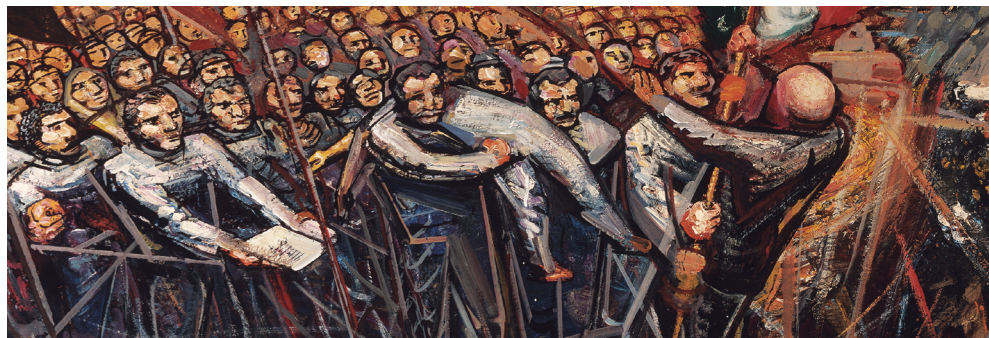
© J. Alfaro Siqueiros, Primera Nota Temática para el mural de Chapultepec (detalle).

En noviembre, se inaugura en el MNBA una muestra por la que el público chileno, quizá sin saberlo, ha esperado 42 años. De su historia, íntimamente ligada a la de la colección del Museo de Arte Carrillo Gil de México, nos habla en este texto uno de los curadores de esta institución, Carlos Palacios.