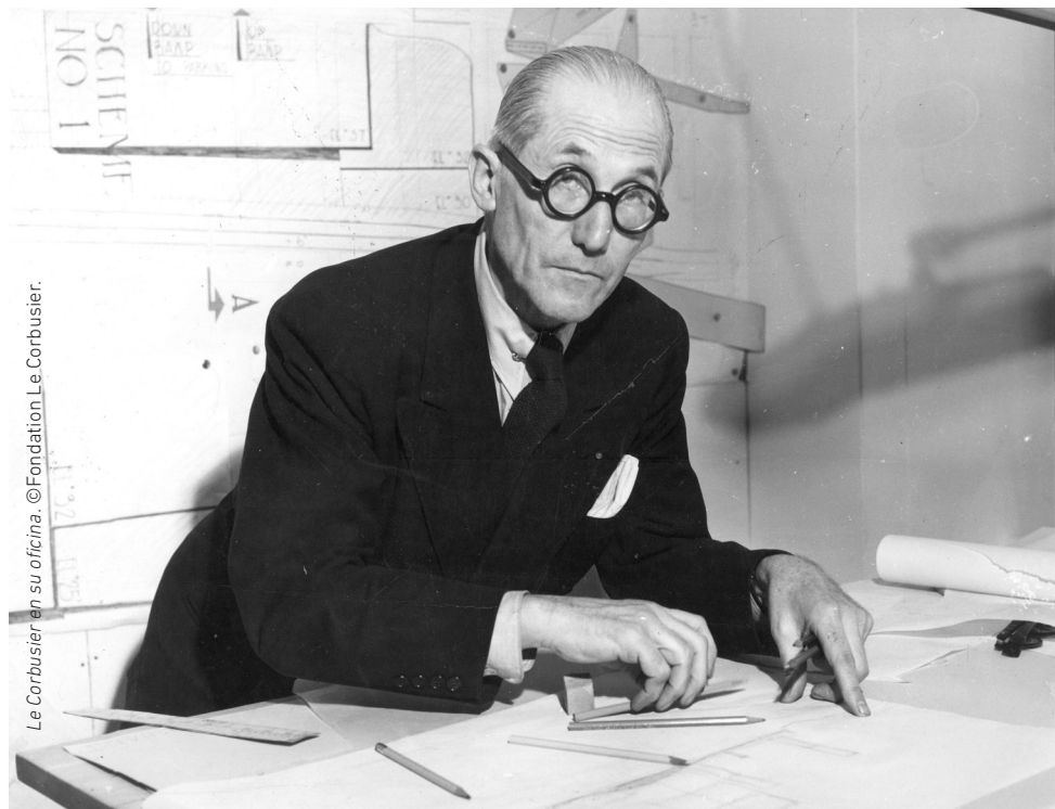
Le Corbusier en su oficina.

El MAC presenta la gran muestra del arquitecto suizo-francés Charles-Édouard Jeanneret-Gris, más conocido como Le Corbusier (1887-1965), en un recorrido que da cuenta de su gran influencia en la arquitectura moderna y, en especial, de su estrecha relación con proyectos llevados a cabo en América del Sur.