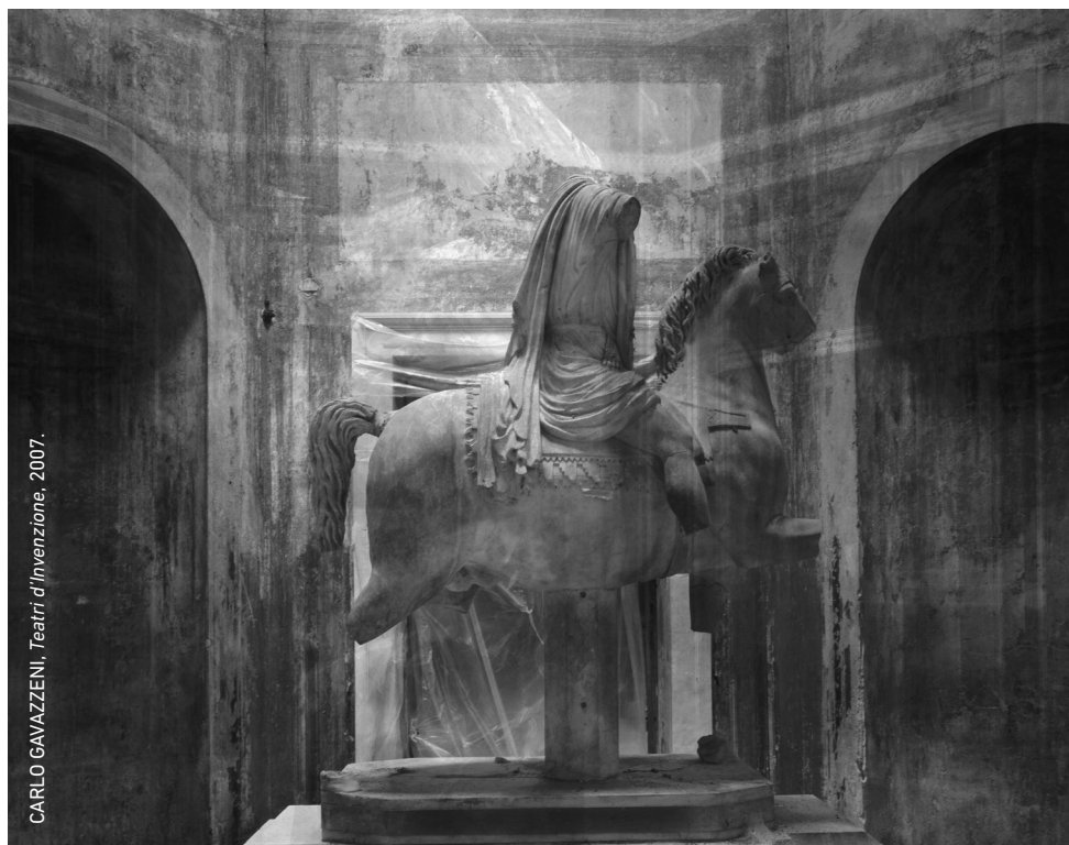
CARLO GAVAZZENI, Teatri d'Invenzione , 2007.

El trabajo del fotógrafo milanés Carlo Gavazzeni (1965) da cuenta de su fascinación por las tomas citadinas y los paisajes urbanos, en un trabajo que utiliza diversas técnicas fotográficas y que a la vez se inscribe en la estética tradicional de los viejos maestros italianos de la pintura.