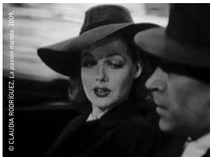
© CLAUDIA RODRÍGUEZ. La pasión manda , 2009.

Un video es una sucesión de imágenes o cuadros que conforman una historia. En La Pasión Manda se eliminan algunos cuadros, mientras que en Avalon se suprime toda la imagen, dejando solo el sonido. Así, los videos que conforman la muestra La imagen acaso II frustran las imágenes y obligan al espectador a buscar en su memoria para completar la escena, vinculándolo personal e individualmente con su percepción sobre la realidad que le acontece. En un mundo