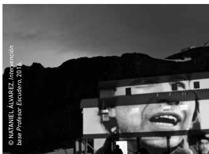
© NATANIEL ÁLVAREZ, Intervención base Profesor Escudero, 2016.

La acción de las proyecciones lumínicas adquirió un sentido particular: los testimonios de los paisajes humanos conformados por los