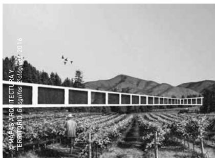
© MAPAS ARQ ITECTURA Y TERRITORIO, G. Aguilera, 2016

Buscando nuevos significados para las áreas periurbanas de la Región Metropolitana