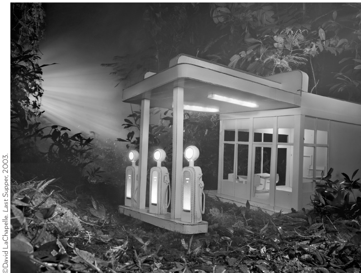
©David LaChapelle. Last Supper, 2003.

HOJAMAC2015 INTERNACIONAL 29 JUL 27 SEP NIVEL 1 y 2