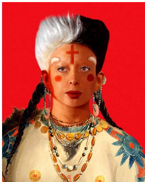
Orlan Indio Americano "Self-Hybridization" # 7 Retrato pintura 2005 Fotografía digital, 60x49 in.

En el largo proceso de transformaciones y operaciones quirúrgicas, ha modificado su barbilla para hacerla parecer a la de la Venus de Botticelli, su frente como la de la Mona Lisa de Leonardo Da Vinci, sus labios como los de la pintura El rapto de Europa de Boucher, los ojos a los de la Psique de Gérôme, la nariz a la de una escultura de una Diana de la Escuela de Fontainebleau.