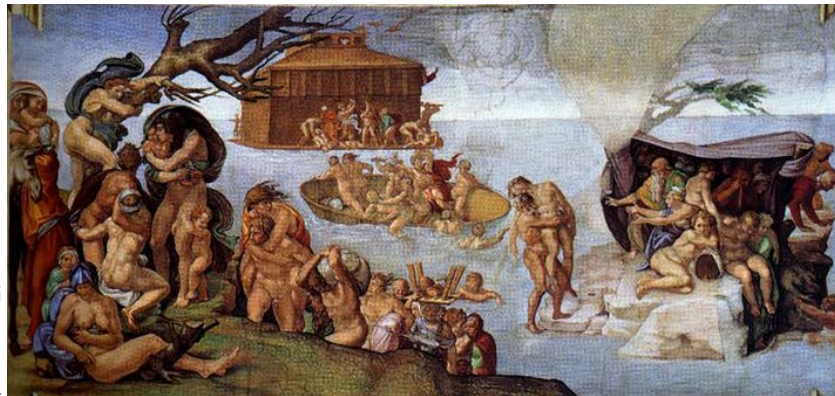
Miguel Ángel Buonarroti El Diluvio Universal, 1509 Detalle de la serie de frescos ubicado en la Bóveda de la Capilla Sixtina, en Roma, Italia.

Miguel Ángel aprendió de la filosofía clásica que un espíritu noble se pone de manifiesto en un cuerpo hermoso y pensaba que la sólo la figura masculina lograba tener las proporciones perfectas. Por esta razón las figuras femeninas de sus frescos aparecen masculinizadas en sus musculaturas.