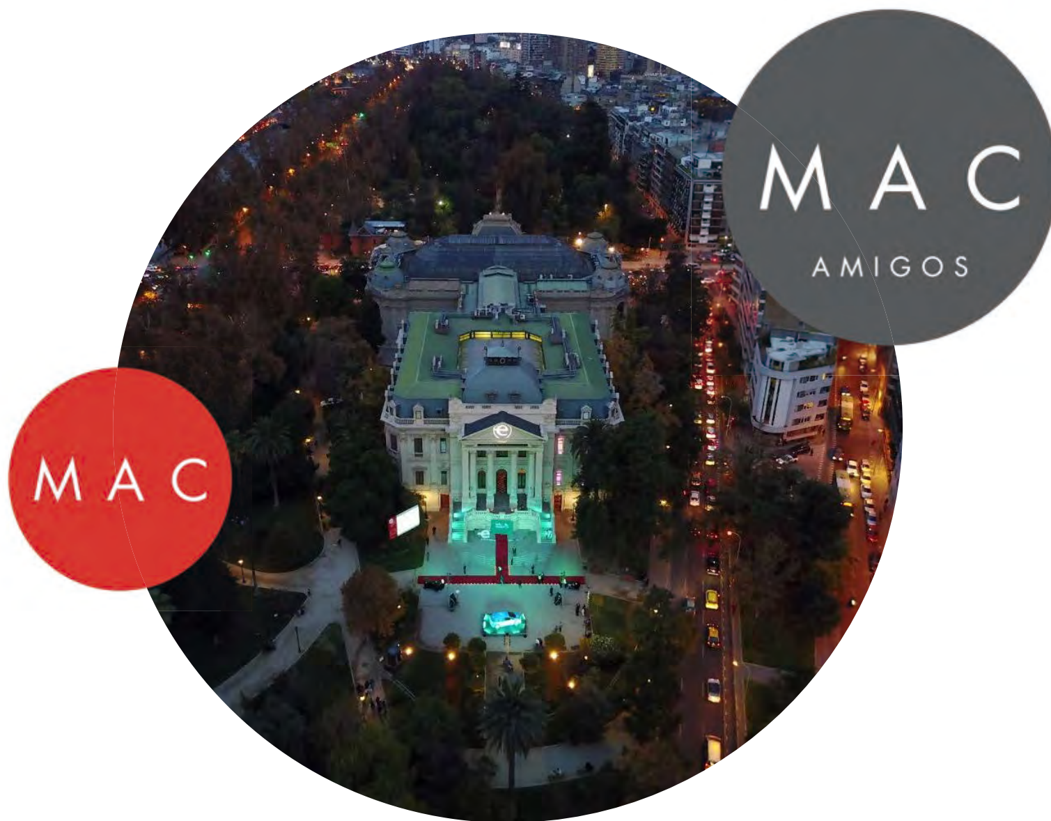
Museo de Arte Contemporáneo – Santiago - Chile