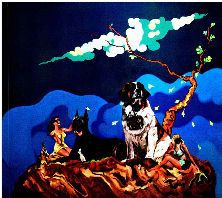
Bonsai, de la obra "Paz perpetua".

Tiraje: Sin Datos Lectoría: Sin Datos Tono: No Definido