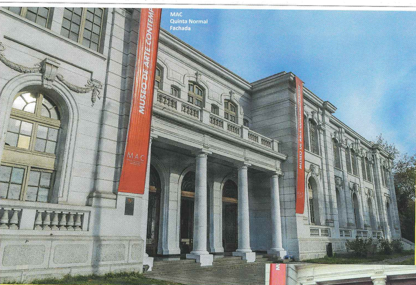
MAC Quinta Normal Fachada