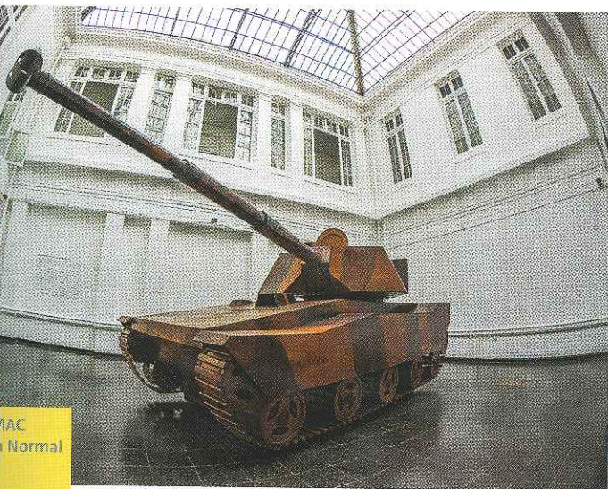
MAC Quinta Normal

A diferencia de otros museos de Chile, el MAC es un museo univer- sitario, perteneciente a la Univer- sidad de Chile, la más prestigiosa y antigua casa de estudios supe- riores estatal. "Aunque tenemos una misión pública, debido a que formamos parte de una entidad de estado, no dependemos directa- mente de la administración estatal, ni formamos parte de la Dirección de Bibliotecas, Archivos y Museos DIBAM", explica la vocería del museo. De este modo, la Facultad de Artes de la Universidad de Chile adjudica un presupuesto anual al MAC, que en el año 2014 ascendió a 120 millones de pesos chilenos. Éste se destina al funcionamiento y mantención de los edificios, pero no es suficiente para financiar exhi-